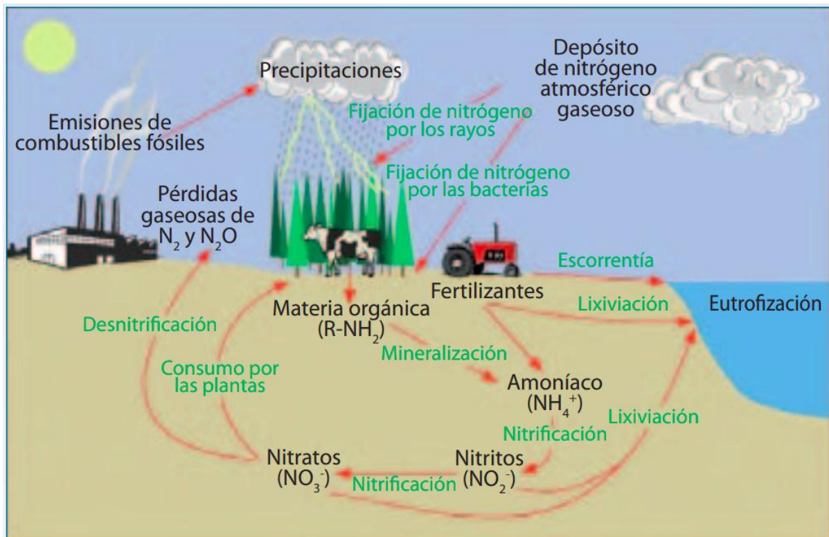
Figura 1. Ciclo del nitrógeno.

El nitrógeno es esencial para la vida en la Tierra, y el ciclo del nitrógeno es uno de los ciclos de nutrientes más importantes para los ecosistemas naturales. Las plantas absorben nitrógeno del suelo, y los animales se alimentan de ellas. Cuando mueren y se descomponen, el nitrógeno vuelve al suelo, donde las bacterias lo transforman y el ciclo comienza de nuevo. No obstante, las actividades agrarias pueden alterar el equilibrio de este ciclo, por ejemplo mediante el uso desmesurado de fertilizantes , causando, por un lado, la contaminación de las aguas y la eutrofización, debido a una carga excesiva de nutrientes, y, por otro, la acidificación y la formación de gases de efecto invernadero, debido a las emisiones gaseosas.