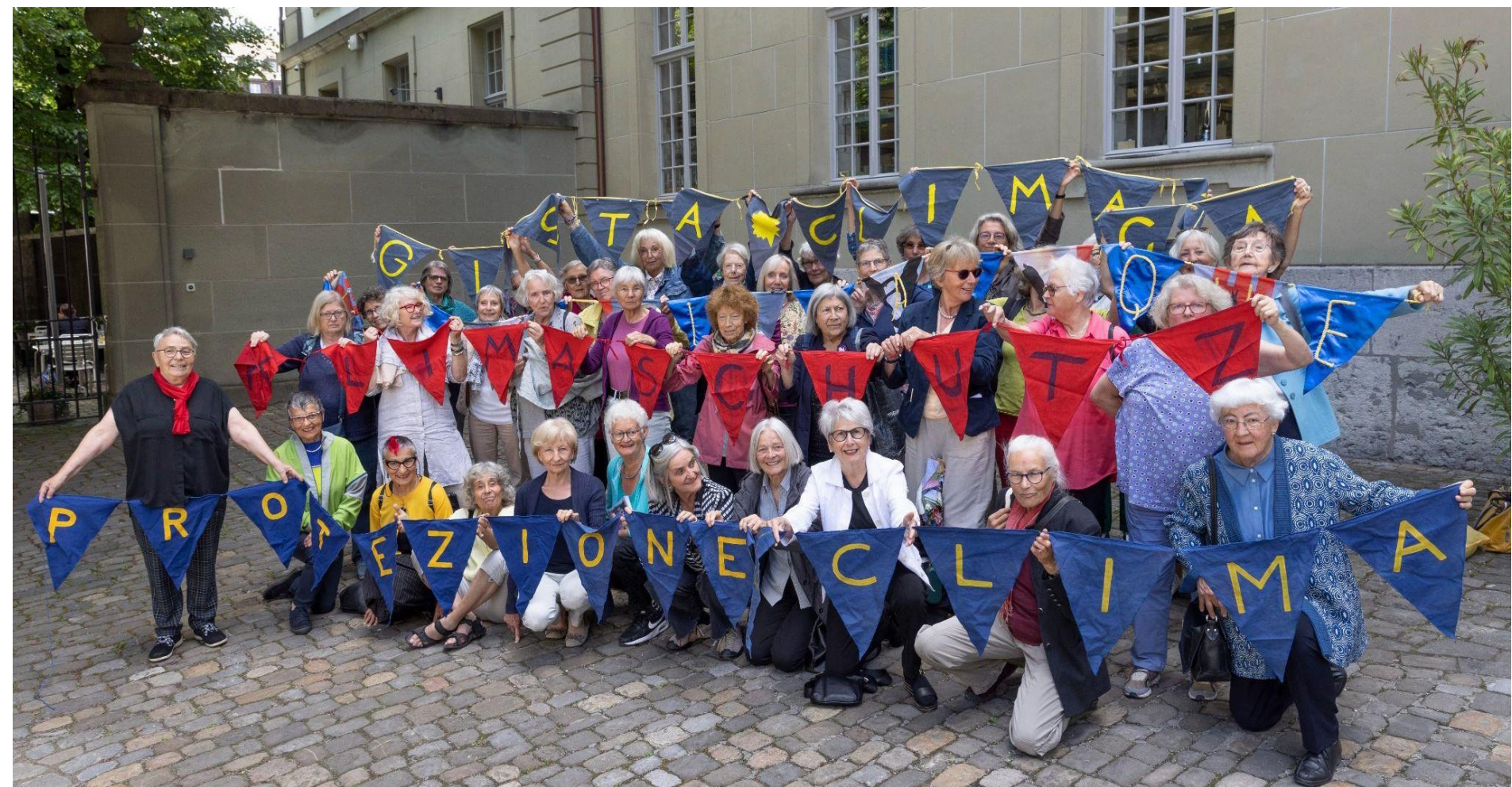
KlimaSeniorinnen Schweiz - Aînées pour la protection du climat Suisse - Anziane per il clima Svizzera