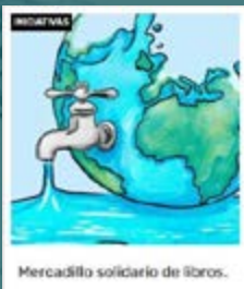
Mercadillo solidario de libros.

Abrir vuestro proyecto en esta PLATAFORMA también os permite compartirlo en redes sociales y viralizar vuestras propuestas para #PROTEGERELPLANETA .