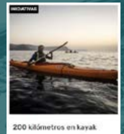
200 kilómetros en kayak

También lo podéis hacer, indicando colegio y población, a través de estas cuentas: