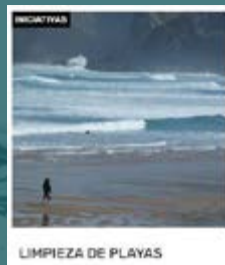
LIMPIEZA DE PLAYAS